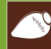
ღვინის ტურიზმი Винный Туризм Wine tourism