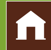
სასტუმრო სახლი Гостевой Дом Guest house